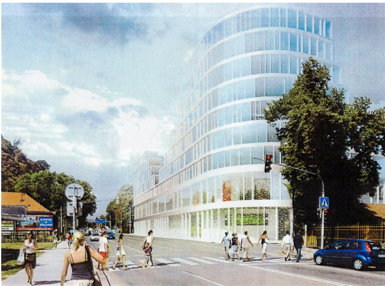
POHĽAD Z ULICE M. R. ŠTEFÁNKA SMEROM DO MESTA

Na stretnutí bol prezentovaný len ten materiál ktorý sa nachádza aj v brožúrke zaslanej do schránok všetkých občanov mesta. Ale existujú aj iné materiály a iné vizualizácie ktoré žiaľ na stretnutí prezentované neboli. Pre informovanosť tu publikujem dve nezverejnené vizualizácie.