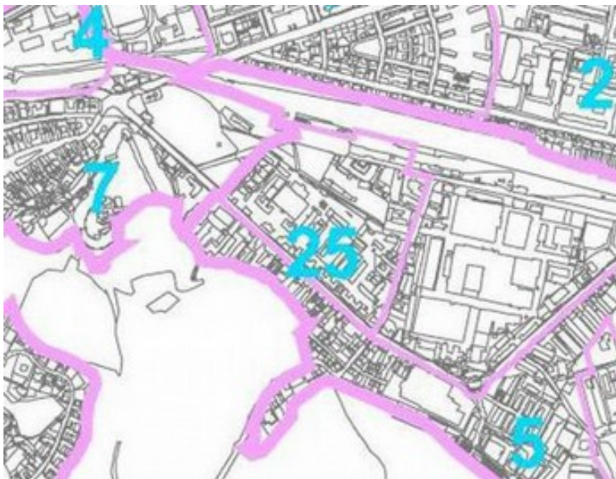
VÝREZ Z PRÍLOHY „C“ - urbanistické obvody

Pred Vianocami minulého roku, v stredu 16. 12. 2015 poslanci mestského zastupiteľstva v Trenčíne schválili zmeny a doplnky územného plánu č. 2 – Terminál. Zmena sa predovšetkým týka priestoru medzi železničnou stanicou a areálom kasárni, a medzi ulicou Kragujevackých hrdinov a Kukučínovou ulicou v urbanistickom obvode č. 25 v mestskej časti Pod Sokolice v lokalite Pri kasárňach a v lokalite Pri stanici.