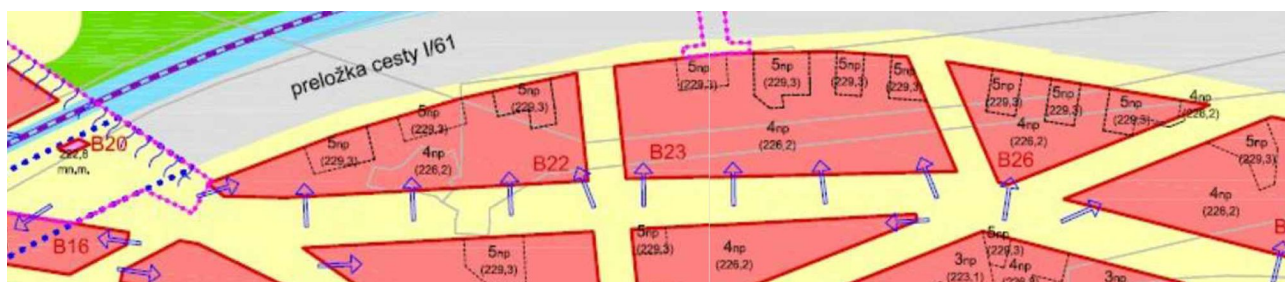
v.č.: 02 VÝŠKA ZÁSTAVBY 4 AŽ 5 PODLAŽÍ

O čo je v území menej zelene o to vyššia je navrhnutá zástavba.